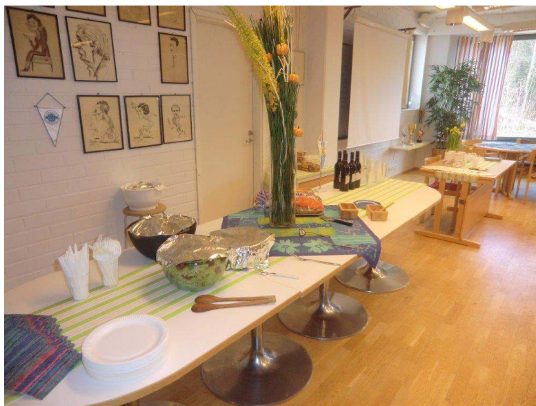
Under plasten göms en massa godsaker!